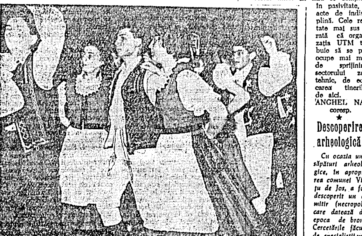
IN CLĂȘEU: formația de dansuri a Școlii profesionale textile, interpretînd un dans maghar.