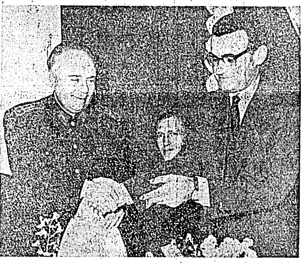
IN CLIȘEU: se luminează diploma de stație fruntaș pe regionala CFR Timișoara.

În zilele bune de lucru, la gospodăria colectivă "Unirea" din Șofrona se desfășoară o activitate rodnică. Briștile gospodăriei au început grăpatul ogoarelor de toamnă, iar de curînd s-a trecut la însămînțatul macului. Lucrările ce sînt în desfășurare sînt: lucrările de curățenie și îngrijirea macului. Munca nu contenește nici în sectorul legumicol, unde de curînd s-a trecut la repicatul roșiilor timpuri în ghivece nutritive. Colectivii pregătesc și vîntoarea recoltă de tutun, amenajînd paturile calde pentru pregătirea răsadurilor necesare.