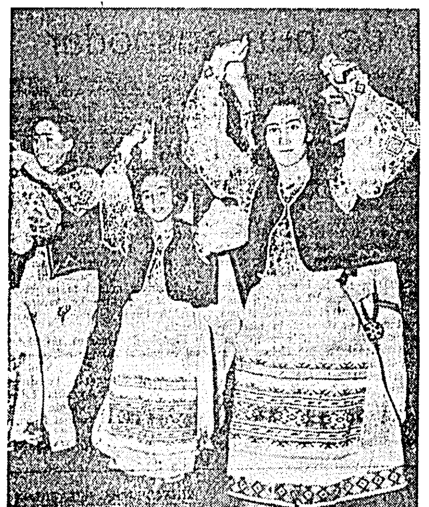
IN CLĂȘEU: dansurile romînești prezentate de tonația Școlii medii nr. 1 „Ion Slavici“ s-au bucurat de un deosebit succes.