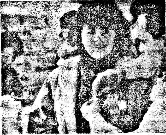
Un mărtișor pentru cel dragi...