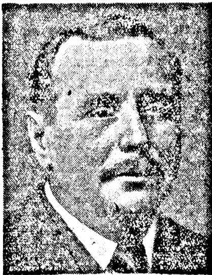
H. G. WELLS

Nincs értelme itt most sokat ide-oda kerdelni.