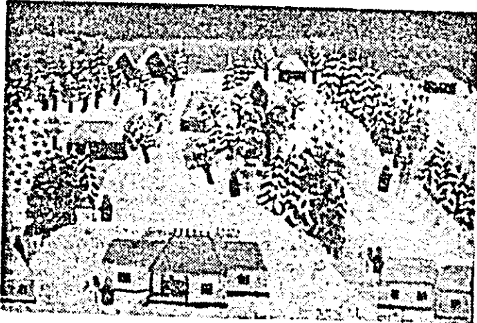
ION NIȚA NICODIN