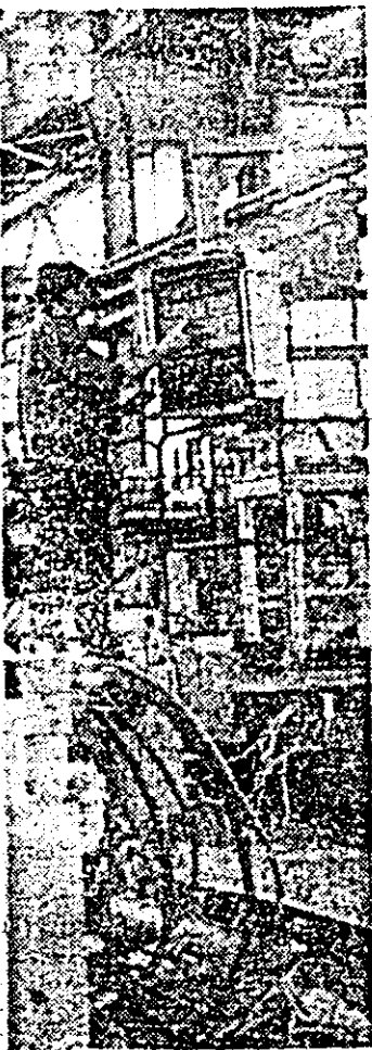
Aspect de muncă în atelierul strung greu al Întreprinderii de mașini-unelte Arad.

• La Nicosia, a început o nouă rundă de convorbiri între președintele Ciprului, Ghiorghios Vassiliou, și liderul comunității turco-cipriote, Rauf Denktaş. A participat reprezentantul special al secretarului general al O.N.U. în Cipru, Oscar Camillon. Interlocutorii au convenit ca următoarea lor întâlnire să se desfășoare la începutul lunii ianuarie 1989.