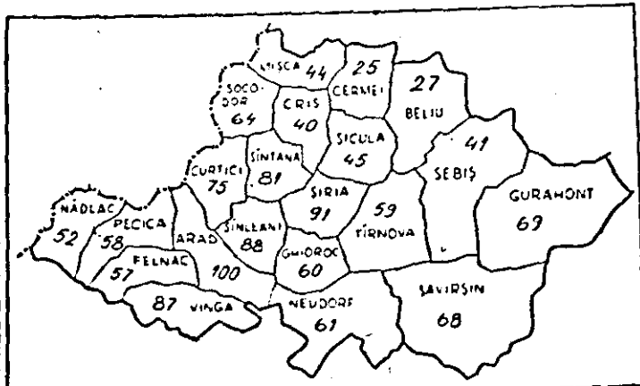
Stadiul primei prășite manuale la porumb în consiliile agroindustriale din județ pînă în ziua de 14 iunie 1980 (în procente față de plan).