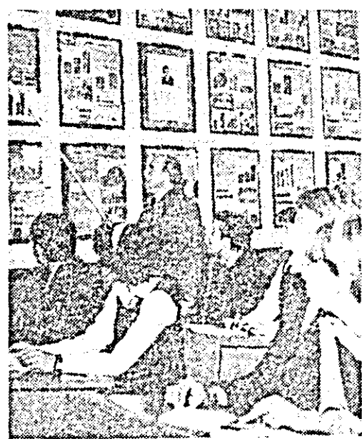
Instantaneu surprins de fotoreporterul nostru în cabinetul de științe sociale.

șie ale școlii. Desigur, și ei se pregătesc pentru un examen. Unii pentru admitere în treapta a II-a de liceu, iar ceilalți