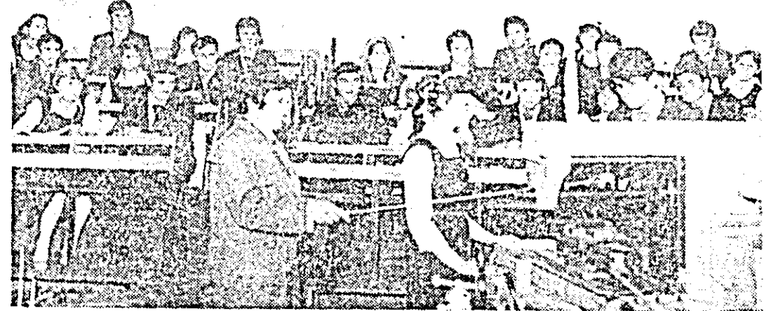
În cadrul laboratorului de mașini unelte elevii au posibilitatea să-și verifice cunoștințele teoretice direct pe mașinile cu care este dotat.

Iată, așadar, tinerii absolvenți ai clasei a VIII-a și tinerii absolvenți ai treptei I de liceu, o școală care vă așteaptă cu porțile larg deschise, în cadrul căreia puteți învăța meserii frumoase, care să vă satisfacă, meserii pe care le veți putea practica în cadrul întreprinderii de vagoane, precum și a celorlalte unități economice de pe meleagurile arădene.