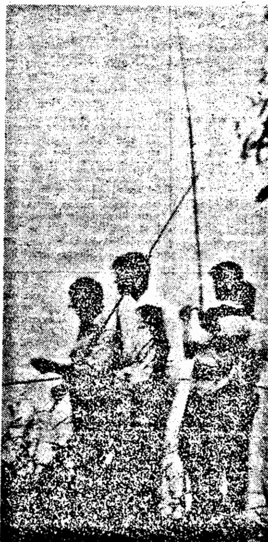
În sîmbătă, e vreme bună și pescarii pot fi găsiți — la înmîlă!

ANUL III | Nr. 441 | Sîmbătă 24 VIII — Duminică 25 VIII '91 | 8 pag. — 3 lei