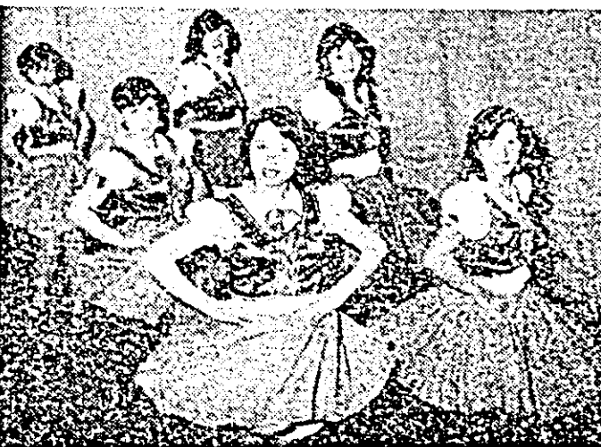
ÎN IMAGINE: Ansamblul folcloric maghiar „Viola“ al Casei municipale de cultură.

Drept răsplată a calității interpretative dovedite de numeroșii artiști amatori care au contribuit la frumoasa reușită a acțiunii, juriul a acordat o serie de premii menite să le consacre și să le încurajeze strădanțiile. Astfel, premiul pentru valorificarea tradițiilor folclorice maghiare a fost acordat formației de dansuri a căminului cultural din Zerind, din partea Consiliului Județean al oamenilor muncii de naționalitate maghiară, alte premii revenind în ordine Ansamblului folcloric maghiar „Viola“ al Casei municipale de cultură și formației de dansuri populare maghiare din Pecica. Premii speciale au mai fost acordate din partea Comitetului Județean de cultură și educație socialistă, a ziarelor „Flacăra roșie“ și „Vörös Lobogó“, Școlii generale nr. 1 Arad.