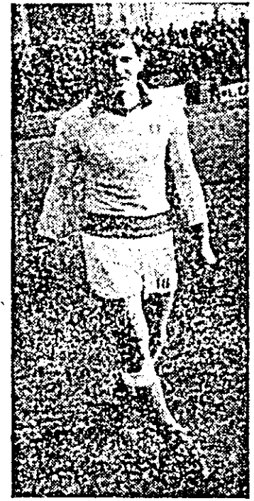
Coraș din nou la UTA.

Joi, la ora 15.45 UTA susține ultimul meci de verificare în compania formației C.J.L. Sighet. Partida are loc pe stadionul UTA, iar în caz de timp nefavorabil, pe terenul din Măcălea.