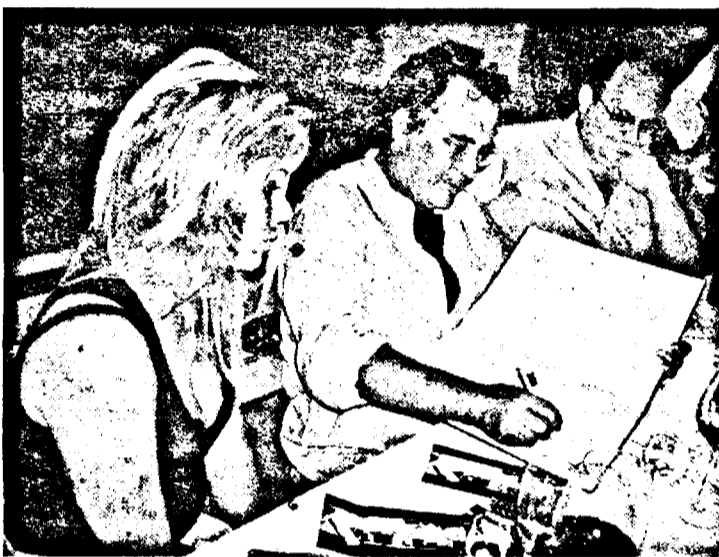
Semnând în Cartea de Onoare...