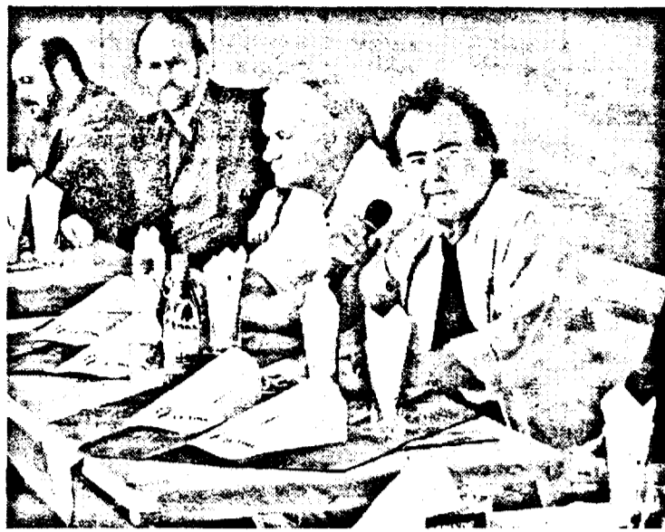
La întâlnirea cu tinerii, pe probleme de luptă împotriva drogurilor