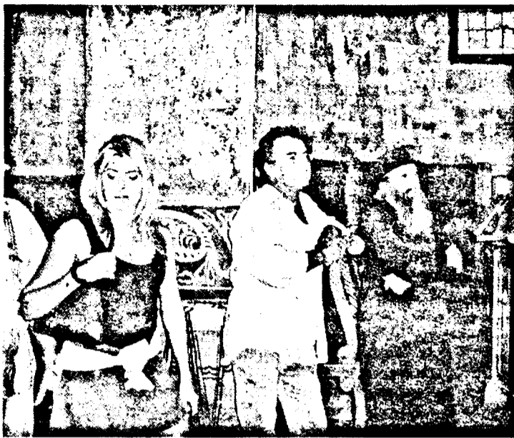
La Mănăstirea Hodoș-Bodrog