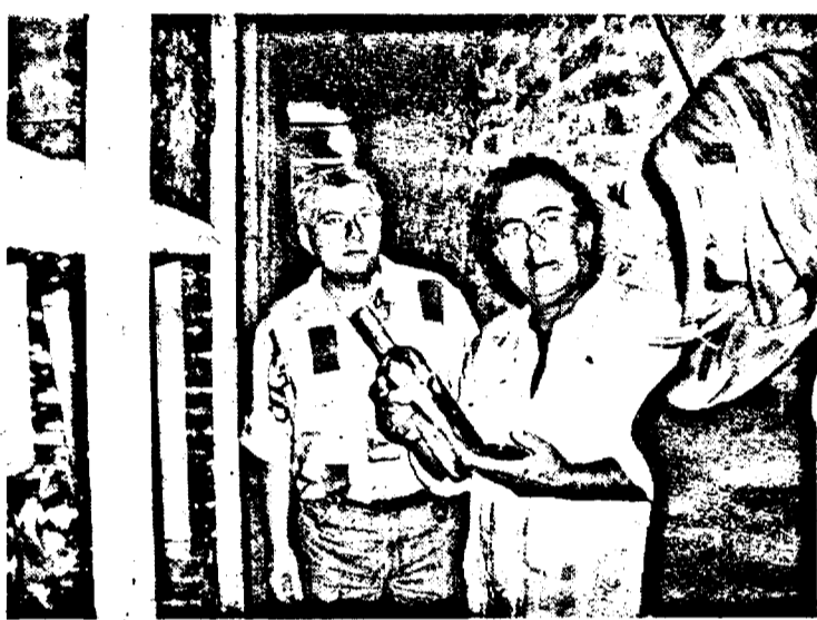
... la Vinoteca Barațca