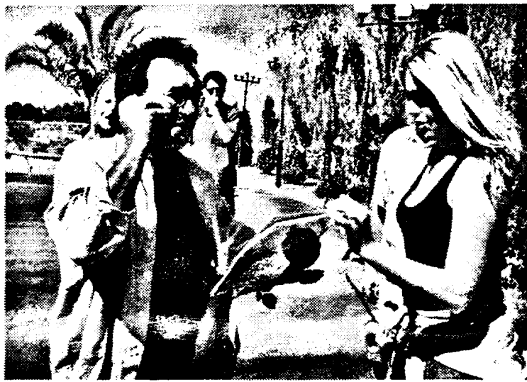
Cu soția la Complexul Călugăreni

Aseară, cu puțin timp înainte de închiderea ediției, s-a finalizat vizita vedetei internaționale Al Bano în județul Arad.