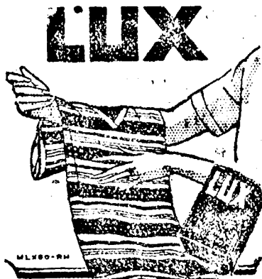
LUX-ot nem lehet kapni seholsem kémérve, hanem csakis eredeti csomagolásban.

— Aradmegyei tanítók gyűlése. Az aradmegyei tanítók egyesülete, Crisan Nikolaj elnöke alatt november 21-én tartja Aradon, a Kulturpalotában rendes közgyűlését. A közgyűlés, amelyen megválasztják a tisztkart, reggel 9 órakor kezdődik.