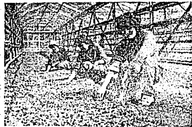
Activitate intensă și în serele S.C.P.L. Aradul Nou.

ceapă, arpagic, usturoi și altele. De asemenea, se pregătesc pentru a fi livrate noi cantități de ceapă verde, ridichi, salată și alte legume de sezon.