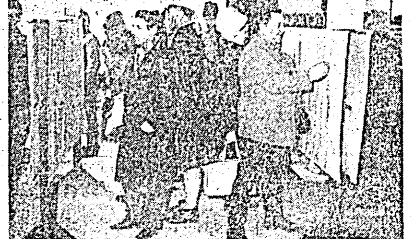
Au fost afișate listele de alegători. Pînă în prezent peste 3600 alegători din totalul de 6021 au verificat înscrierea lor în liste.

În această perioadă se desfășoară o largă acțiune de susținere a campaniei electorale prin conferințe, expuneri, simpoioane etc. Pe această linie se înscrie expunerea „Pe noi trepte, ale bunăstării și fericirii” prezentată în fața a peste 250 alegători.