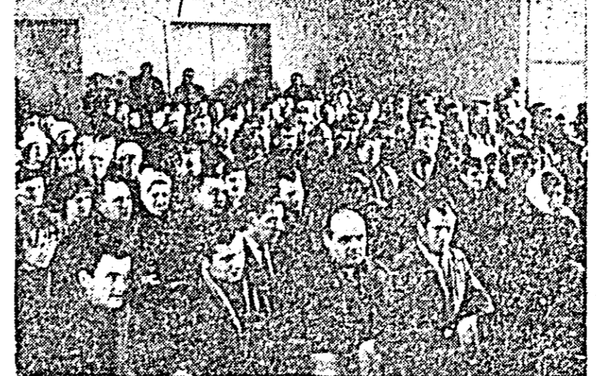
În această perioadă se desfășoară o largă acțiune de susținere a campaniei electorale prin conferințe, expuneri, simpoioane etc. Pe această linie se înscrie expunerea „Pe noi trepte, ale bunăstării și fericirii” prezentată în fața a peste 250 alegători.

Duminică s-au deplasat conferențarii în șapte localități învecinate cu orașul nostru, care au făcut expuneri despre avîntul economiei naționale, despre realizările obținute în anii socialismului.