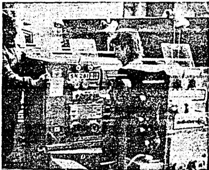
Întreprinderea de mașini-unelte. În secția montaj, un nou lot de strunguri este pregătit pentru a fi expediat beneficiarilor externi.