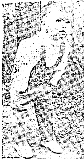
Ce-o mai fi și asta?