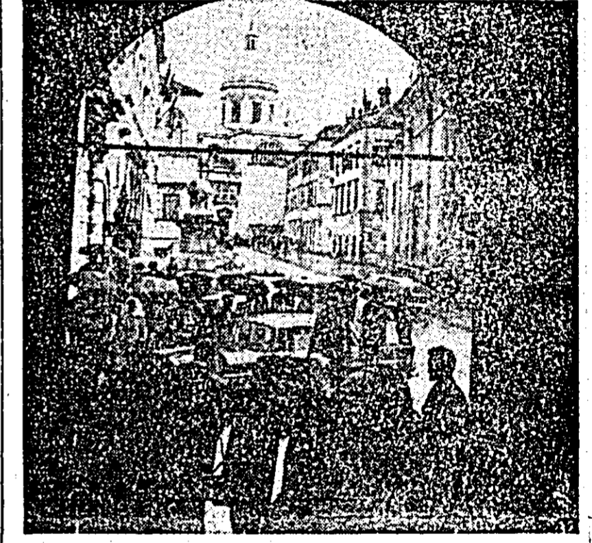
R.S.F. IUGOSLAVIA — Vederea din Dubrovnic — orașul vechi

Gheorghe Traikov și Todor Jivkov au acceptat invitația președintelui Habib Bourguiba de a face o vizită oficială în Tunisia.