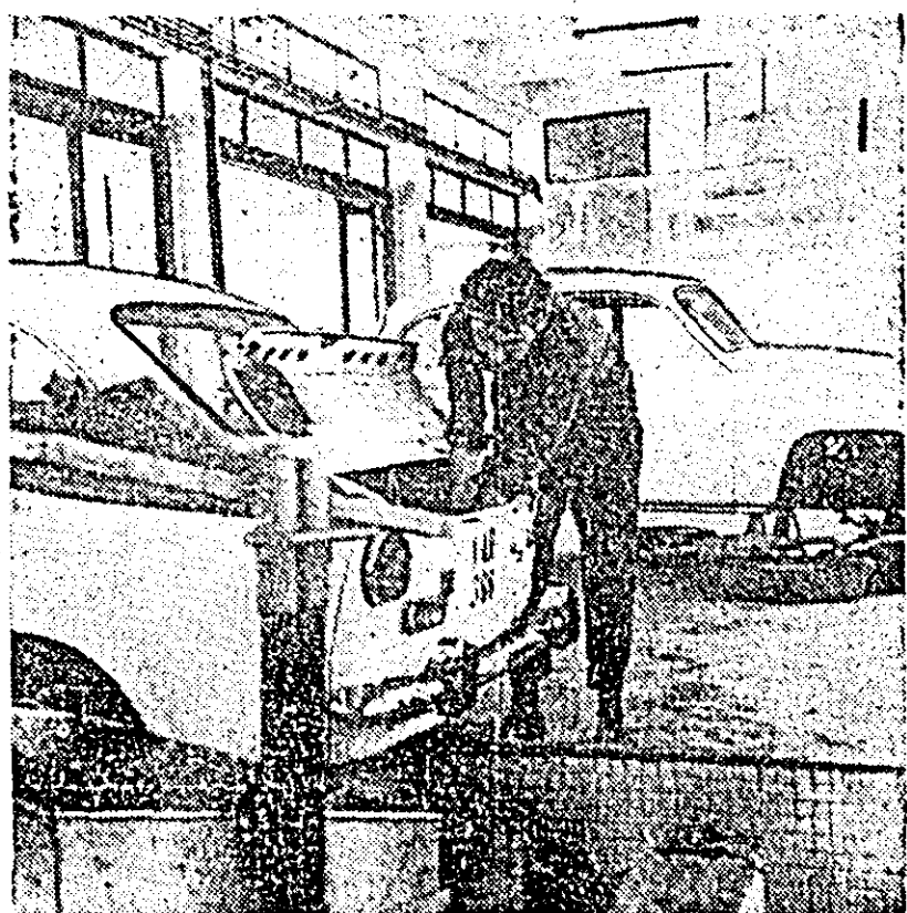
In noua hală de lucru de la auto-service Arad.