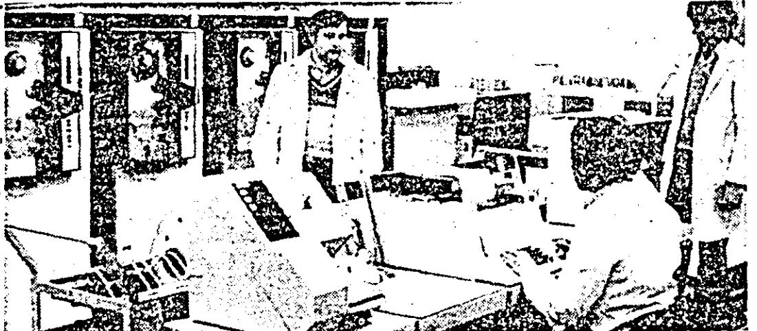
Aspect de la centrul de calcul al Întreprinderii de vagoane Arad.

primã chiar prelucratã primar. La articolele de artizanat o clãrã e deosebit de expresivã pentru ceea ce înseamnã valorificarea superioarã. Dintr-un metru cub de lemn, care costã 1 300 de lei, se produc articole cu o valoare de circa 30 000 lei. Iatã deci și explicația de ce în acest an sectorul implettiturilor își sporește producția cu 30 la sutã față de 1978, iar cel de artizanat de peste trei ori.