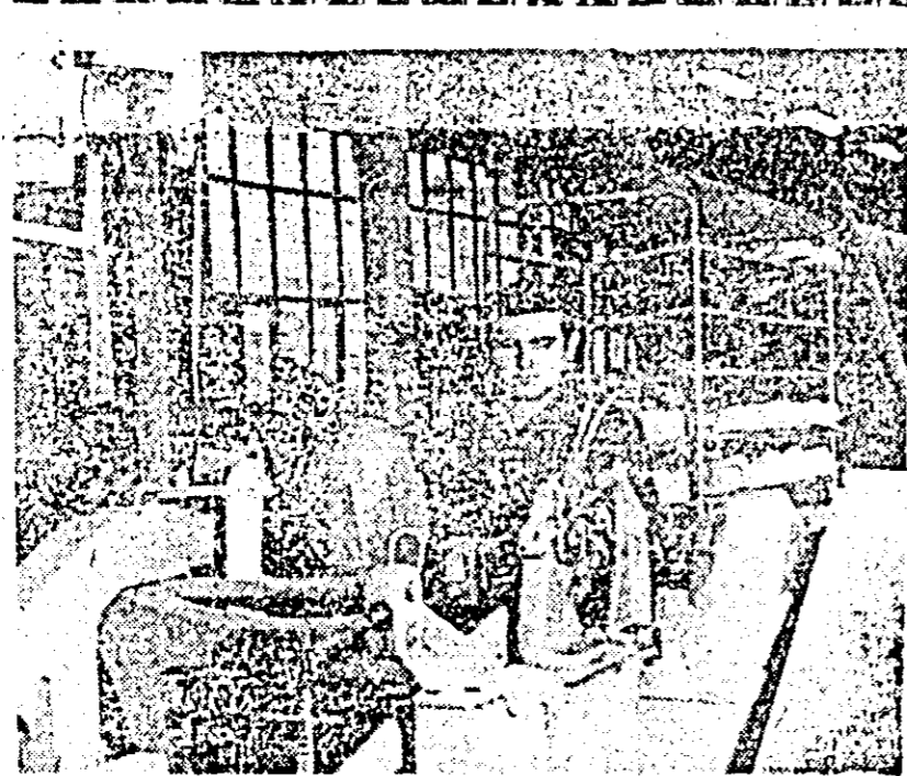
Modernizată cu strunguri de copiat, secția calapoade a I.S. „Libertatea” se afirmă tot mai mult. Produsele executate aici se bucură de aprecierea beneficiarilor. IN CLISEU: o secvență din această secție.

Ne-au plecat satisfacții. La data 28 februarie începe organizarea producției cu 2 la sută, dar rebuturile aveau un „avans” alarmant: 56 la sută! Corelația de-a dreptul de necrezut. Dar nici conducerea secției și uzinei, după situația de pe teren, nu pare să-l acorde prea mare importanță. Deși hala de depozitare și pregătire a nispurilor de turnare trebuia să fie gata de anul trecut, nu sint semne de finalizare. În