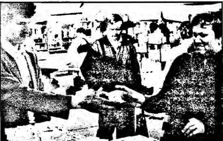
„Da, văd că are timbru... Dar țigările străine unde-au dispărut?”

„Cu țigările netimbrate ce-ați făcut?”, l-am întrebat pe