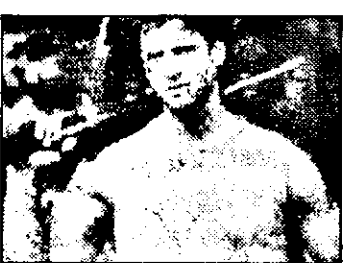
PRO 7-23,00 Răzburarea poliștilului - f. acț. SUA

11,00 Film artistic - Danielle Steel's: Luna mincinoasă - rel. 12,55 Știrile Pro TV 13,00 Film serial - Cheers , ep. 12, rel. 13,30 Lege și ordine - f. s., ep. 23, rel. 14,30 Gillette - lumea sportului 15,00 Beverly Hills - f. s., ep. 17, rel. 16,00 M.A.S.H. - f. s., ep. 90, rel. 16,30 Paradise Beach - f. s., ep. 114 17,00 Film serial: Tănăr și neliniștit - ep. 17 17,55 Știrile Pro TV 18,00 Taxi - f. s., ep. 8 18,30 Bună seara, București! Realizator Ruxandra Săraru 19,00 Cheers - f. s., ep. 13 19,25 Vremea - buletin meteo 19,30 Știrile Pro TV 19,55 Doar o vorbă să-ți mai spun... Realizator George Pruteanu 20,00 Film artistic - Colegiul Ridgemont, US, 1982 Regia: Amy Hecherling. Cu: Sean Penn, Judge Reinhold, Brian Bacher O extraordinară comedie despre viața tinerilor din zilele noastre. Admirati-l pe Sean Penn într-un rol cum nu l-ați mai văzut vreodată! El întrucașează rolul lui Jeff Spicoli, un tănăr care merge la surf în fiecare dimineață și fumează câteva țigări cu marihuana considerând că școala este neinteresantă pentru el. Se distrează oricunde ar fi, iar situațiile hazlii nu întârzie să apară. Nu rata șansa de a fi încă o dată adolescent urmărind filmul „Colegiul Ridgemont High” La Pro Tv. 21,50 Știri Pro TV