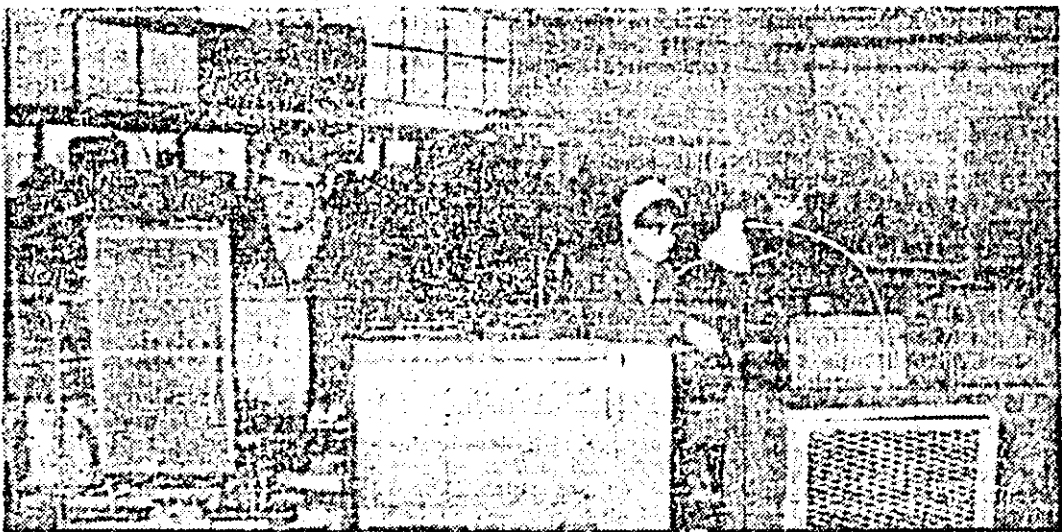
Aspect de muncă în scolaria întreprinderii de vagoane Arad.

• Congresul Sindicatelor Britanice (T.U.C.) a cerut Administrației S.U.A. să renunțe la efectuarea unei noi experiențe nucleare și să se alăture moratorului U.R.S.S. în acest domeniu.