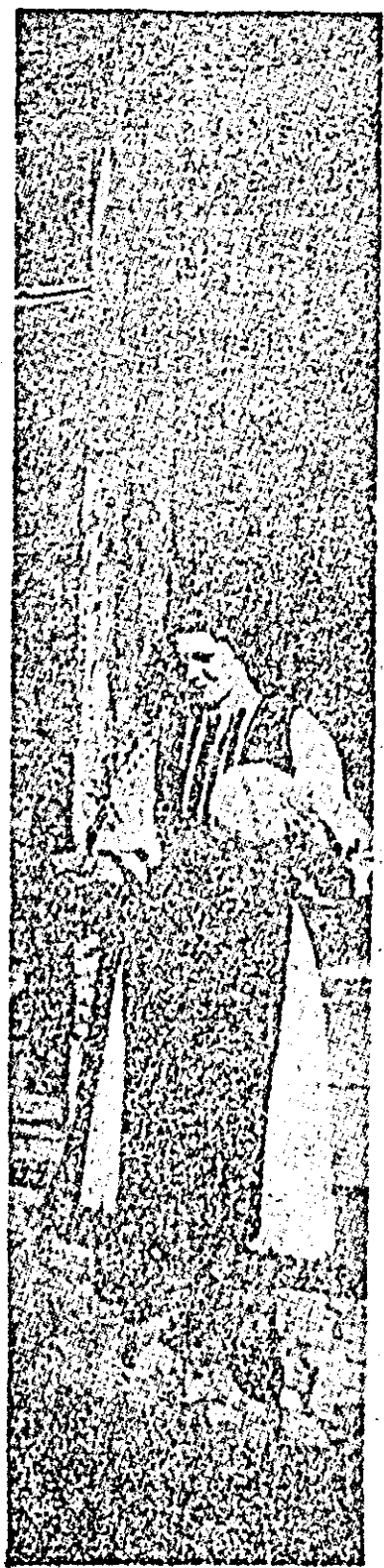
Frumos și plin de pitoresc o portul poporului nostru...