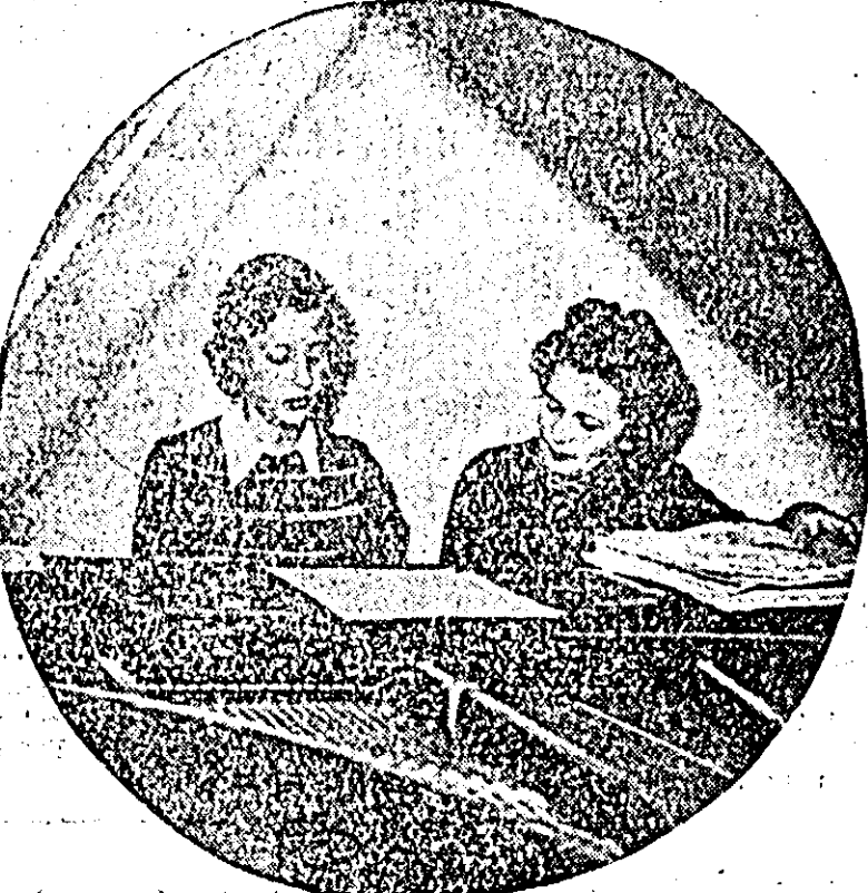
CLISEUL DE JOS: Aspect din secția artă plastică a Școlii populare de artă.