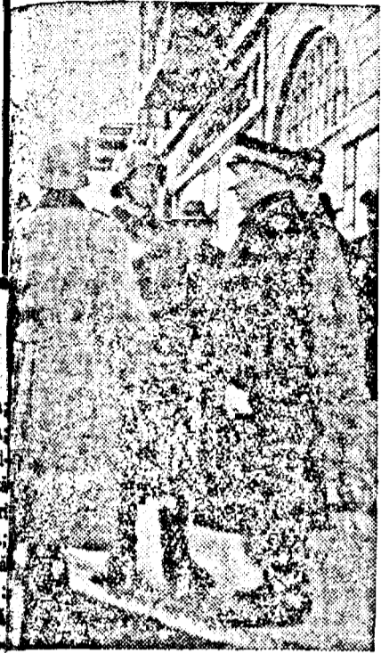
Soldatii germani stand de vorba cu un politist danez.