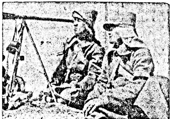
Armata din Orient a aliaților se pregătește: artileria la manevre în deșert

Socotim că înfășit, se va pune capăt speculei făcute cu pieile.