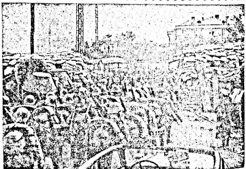
Intrarea trupelor române în Odessa