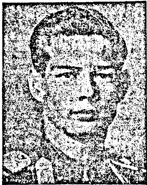
M. S. REGELE MIHAI I

Proclamația Marelui Stat Corporativ Român, cuprinde principiile fundamentale ale Noului Stat Corporativ Român. Aceste principii sunt exprimate clar, într-o formă precisă, așa după cum