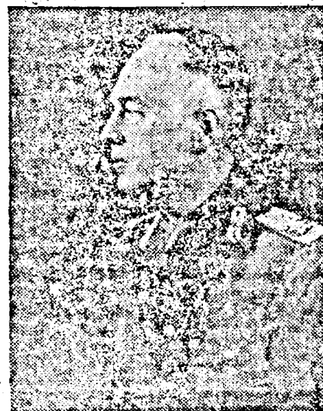
MAREȘALUL ION ANTONESCU

sânge omenesc, va realiza noul stat românesc în chipul cel mai firesc, fiindcă nimic nu mai poate da fericire neamului nostru decât realizările sublime ale ideii naționale, care se intrupează astăzi în noul stat