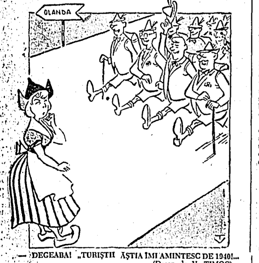
DEGEABAI "TORIȘTII AȘTIA ÎMI AMINTESC DE 1940..." (Desen de V. TIMOC)

Militarii din Bundeswehr cantonați în Olanda încearcă să-și camufleze cât mai mult prezența din cauza ostilității populației.