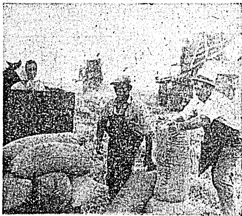
Recoltă bogată la cooperativa agricolă din Vârșand.