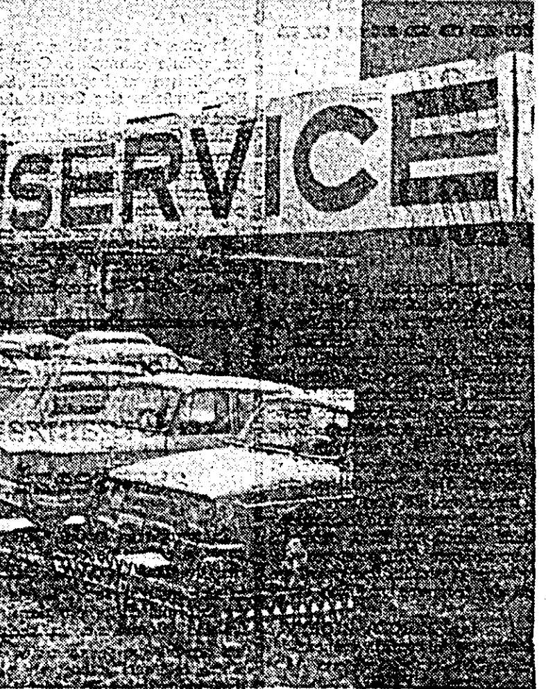
Un loc căutat de automobilști: Unitatea Autoserviciu a cooperativei „Precizia” Arad.