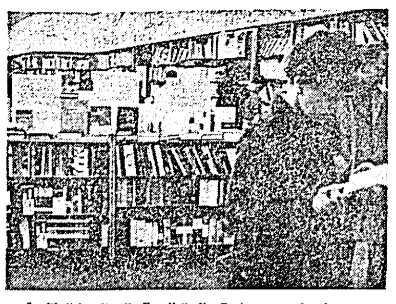
La librăria editurii „Eryolle” din Paris a avut loc inaugurarea unei expoziții a cărții științifice și tehnice românești.