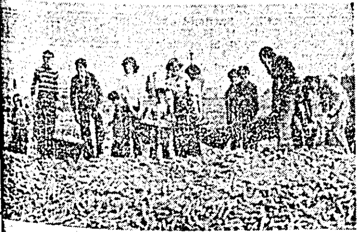
Numeroși elevi sprijină campania de toamnă. În clișeu: un grup de la I.A.S. Mureș unde elevii Liceului pedagogic adună lăzile de porumb.

Pe de altă parte un singur C.S.U. pentru local coceni la vederea eliberării terenului este prea puțin căci 4 tractoare așteptau luni în jurul orei 13 să intre în brazdă pentru arături. Iată o altă problemă pe care S.M.A. Vinga, are datoria să o rezolve cit mai operativ.