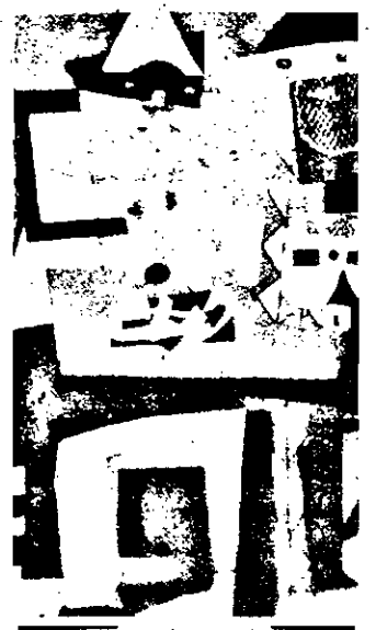
Pablo Picasso - „CEI TREI MUZICIENI”

Talent. Har. Simțăm apropierea de divin. Dar, fără