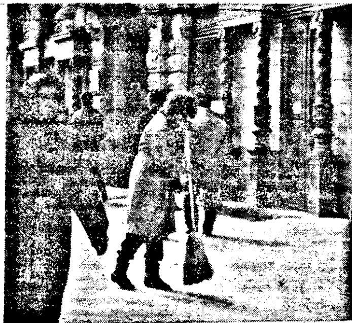
Deci, se mai poate și așa...

● Polonia a devenit oficial cel de-al 26-lea stat membru cu drepturi depline în Consiliul European, cea mai veche organizație politică a Europei.