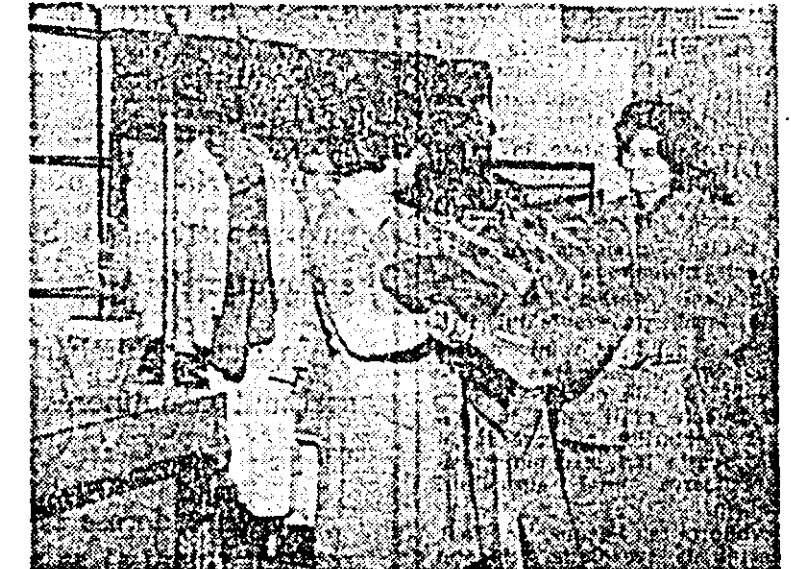
O gamă largă și variată de covoare și confecții de sezon oferă în această perioadă și magazinul de prezentare al U.J.C.M. din municipiul Arad, B-dul Republicii.