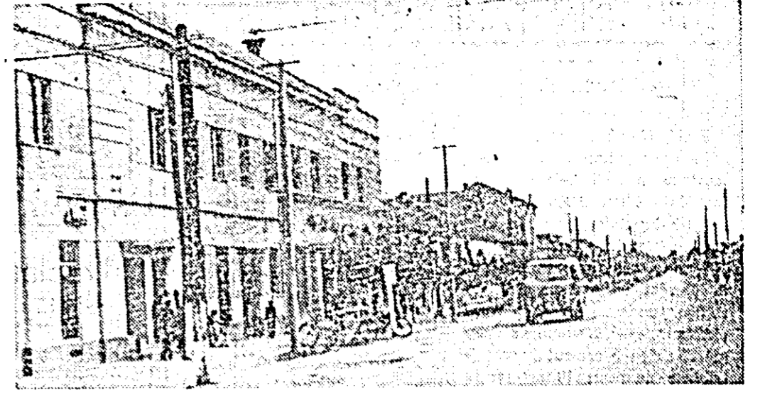
Una din străzile comunei Vinga

Așezată de ambele părți ale șoselei asfaltate Arad-Timișoara, comuna Vinga este una dintre cele mai frumoase localități ale raionului nostru.