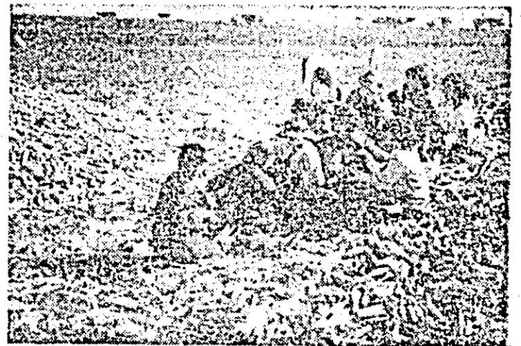
Alături de părinți, copiii din comuna Sîntana — elevi ai școlilor generale — participă la depănșutul porumbului la C.A.P. Caporal Alexa.