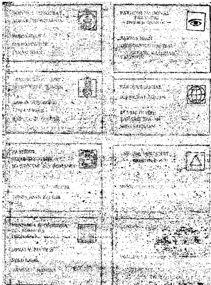
Aşa arată un buletin de vot. Ştampila se aplică într-unul din patrulete.

te contrarevoluţionară. A fost eliberat în 1964, conform decretului nr. 411/1964. În acelaşi an s-a angajat la şantierul din Arad al ICM Braşov unde a lucrat pînă la pensionare, în anul 1988. Este căsătorit, locuieşte în Arad şi este tatăl unui băiat care este student în anul cinci al facultăţii de electrotehnică din Timişoara.