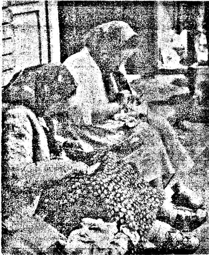
...și acum se face moneda rui.