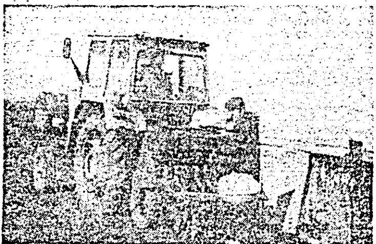
La Asociația legumicolă Haras se însămînțează ultimele suprafețe cu ceapă pentru arpagic.