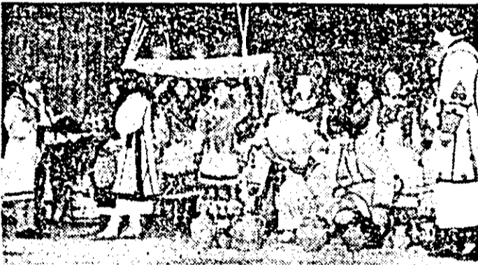
Pe scena Festivalului național „Cîntarea României” cu obiceiul popular „Tîrgul sîrutului”.