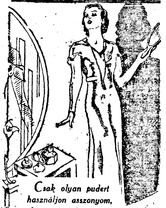
Csak olyan pudert használjon asszonyom, melyet az arcöre elvise!

Egy rossz minőségű pudert árt az arcörnek, mert megtámadja az arc-szöveteket és ráncokat okoz. Tehát legyen elővigyázatos pudere kiválasztásában.