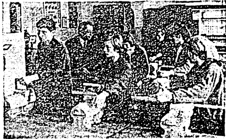
În atelierul școlii, în cadrul activităților tehnico-productive, elevii Liceului nr. 7 din Arad, capătă deprinderile necesare meseriei de lăcătuș.