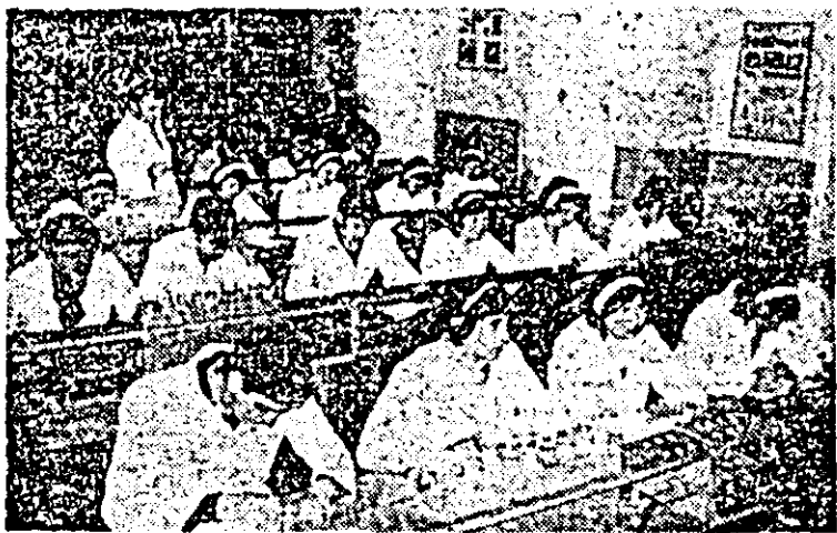
Laboratorul de chimie — locul unde elevii Liceului din Nădlac își îmbogățesc cunoștințele practice și teoretice.