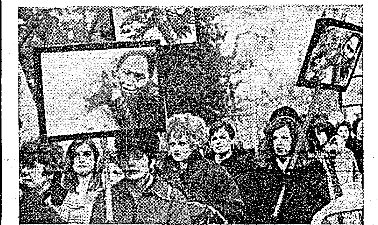
Opinia publică de pe toate meridianele și paralelele globului își exprimă solidaritatea cu cauza dreptății a poporului vietnamez, cerînd încetarea războiului dus de SUA în această parte a lumii. ÎN FOTOGRAFIE: Aspect de la o mare demonstrație ce a avut loc recent la Londra împotriva războiului din Vietnam.

mai mulți vorbitori, printre care Otakar Simunek, care și-a anunțat demisia din funcția de membru al Prezidiului Comitetului Central al PC din Cehoslovacia.