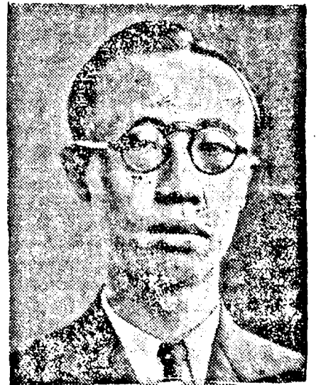
PA-YI mandzsu császár

Mandzsuria császáráról az a hír járta be a világsajtót, hogy merényletet követtek el ellene. Mandzsukuo kormánya ezt a hírt megcáfolta és kijelentette, hogy szerencsétlenség történt. Párisi lapok most megírják, hogy a császárt