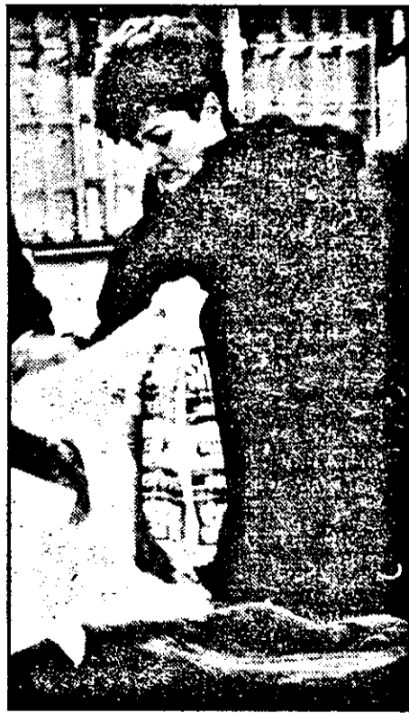
Or fi sacozele prea mari sau salariile prea mici?...

Aveți destulă treabă și la domiciliu, nu mai era nevoie să aduceți și serviciul acasă.