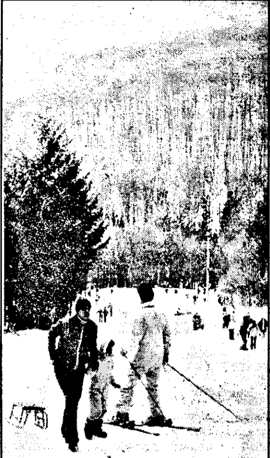
Și totuși... Moneasa - o stațiune pentru sporturi de iarnă.