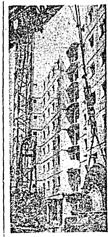
Aspect de pe șantierul construcției de locuințe din zona Micălaça.