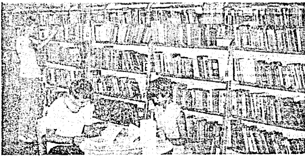
Aspect din secția pentru copii a Bibliotecii Județene Arad.