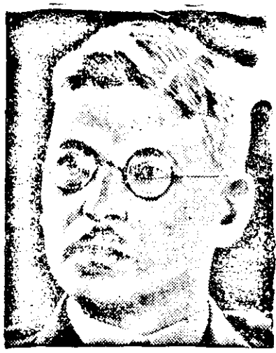
Bundeskanzler Dr. Schuschnigg