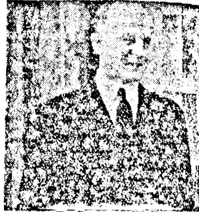
D. Sumner Welles

Ostetia Vaticanului, 19. (Rador.) — Înainte de ora 10, d. Sumner Welles a sosit de d. Hyron Taylor, a sosit la Vatican unde a fost primit cu ceremonialul obișnuit. La ora 10, trimisul președintelui Roosevelt a fost introdus în biblioteca privată a Șerbanului Pontif. Acolo diplomatul american a avut o lungă conversație cu Papa Pius 12-lea. După 50 de minute, d. Sumner Welles a făcut o vizită secretarului de stat cardinalul Maglione.