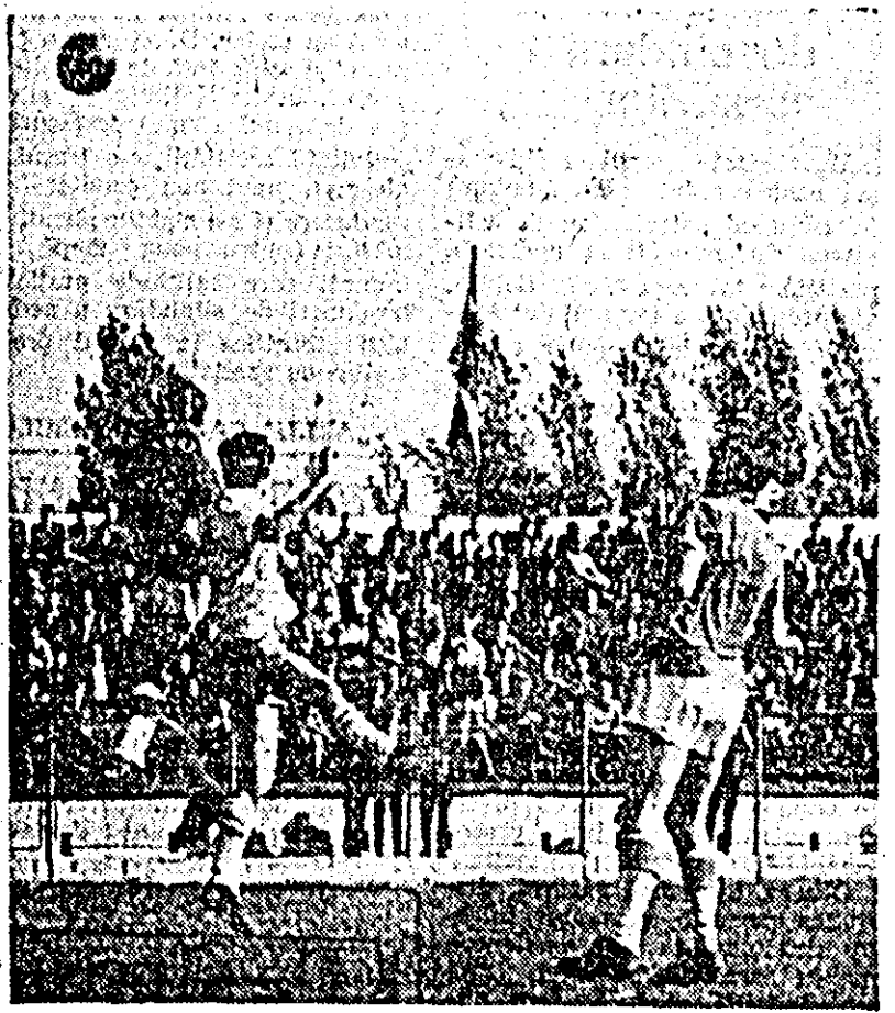
O încă din jocul CFR Arad—CFR Cluj.

cări din vest și nord-vest. Temperatura în scădere ușoară, ziua va fi cuprinsă între 14 și 23 grade, iar noaptea între 6 și 12 grade.