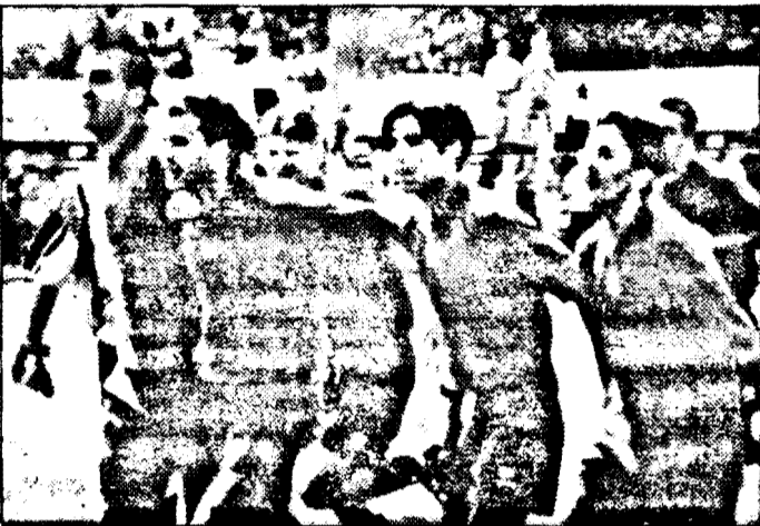
Jucatori aradani fericiți, salutând publicul. O imagine ce am dori să o revădem, mâine, după meciul cu F.C. Brașov.

dită în funcție de adversar. „Știm că F.C. Brașov face din apărare punctul său forte și de aceea va trebui să găsim soluțiile contracarării acestui joc.