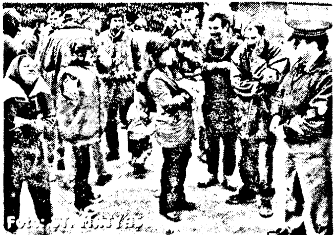
ampreantați, li s-a dat drumul, majoritatea fiind îndrumați înspre locurile lor de domiciliu. Cel mai mult nu locuiesc pe teritoriul județului Arad, venind aici doar pentru a cersii.” EUGENIA BĂRDAȘ

În dimineața, în jurul orei șase, Poliția, împreună cu reprezentanții ai Direcției pentru Protecția Copilului și ai Primăriei, au efectuat o acțiune comună în zona Podului Grădite și a Stației CFR Arad, de unde au adunat mai bine de 30 de boschetari care își făceau vechi în stradă. Respectivii au fost transportați la sediul Poliției, unde au fost amprentați și fotografiati. Acțiunea a fost demarată în scopul asigurării siguranței populației. Boschetarii reprezentând, în repetate rânduri, un pericol real pentru cetățeni cumsecade. Biroul de Presă al Poliției informează: „După ce boschetarii au fost