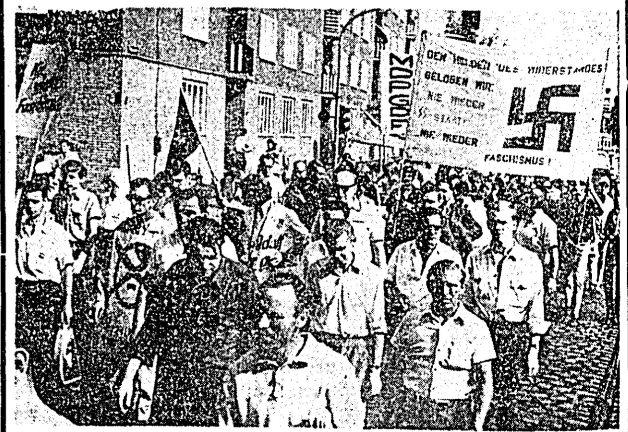
R.F.G. — La Düsseldorf, peste 10.000 de locuitori au protestat împotriva adunării Partidului Național Democrat condus de Adolf von Thadden, partid de orientare neozaristă, în Sala Congreselor. ÎN FOTOGRAFIE: Demonstrații pe străzile orașului cu pancarte pe care se poate citi: „Națiști, afară din Düsseldorf”, „Un Adolf a fost destul!”.

PARIS 30 (Agerpres). — Președintele Mauritaniei, Moktar Ould Daddah, care se află la Paris într-o vizită oficială, a avut o întrevedere cu președintele Franței, Georges Pompidou. După cum a arătat într-o conferință de presă a fost abordată problema Orientului Apropiat, în care poziția sa este cea a președintelui francez „sînt foarte apropiate”. Moktar Ould Daddah a adăugat că a fost de asemenea, evocată situația din Nigeria, dar, a precizat el, în această problemă „punctele noastre de vedere nu coincid”. Președintele Mauritaniei a anunțat cu acest prilej că țara sa va participa la o conferință islamică la nivel înalt convocată ca urmare a incendiării moscheii Al Aksa, dacă aceasta se va întruni. El a confirmat, de altă parte, că va participa la conferința Organizației Națiunilor Unite, care urmează să se întrunească la Addis-Abeba.