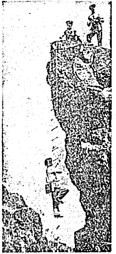
In clișeu: în căutarea celui mai bogat filon de zinc, geologii vietnamezi trebuie adesea să dovedească și însușiri de alpinști...