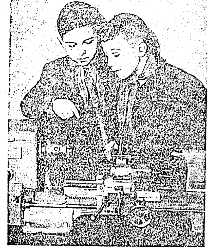
Munca la string nu e tocmai ușoară. Ea cere multă migală și pricepere. În timpul vacanței numeroși pionieri și școlari învață tainele acestei profesii.