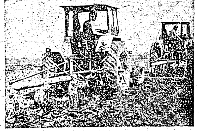
Pregătirea terenului pentru însămînțările de toamnă la C.A.P. „Steagul roșu” — Pecica.