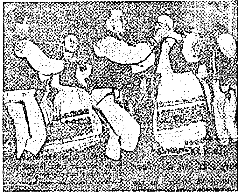
IN CLIȘEU: Echipa de dansuri populare de la Intreprinderea UIL „Cheresteu”...