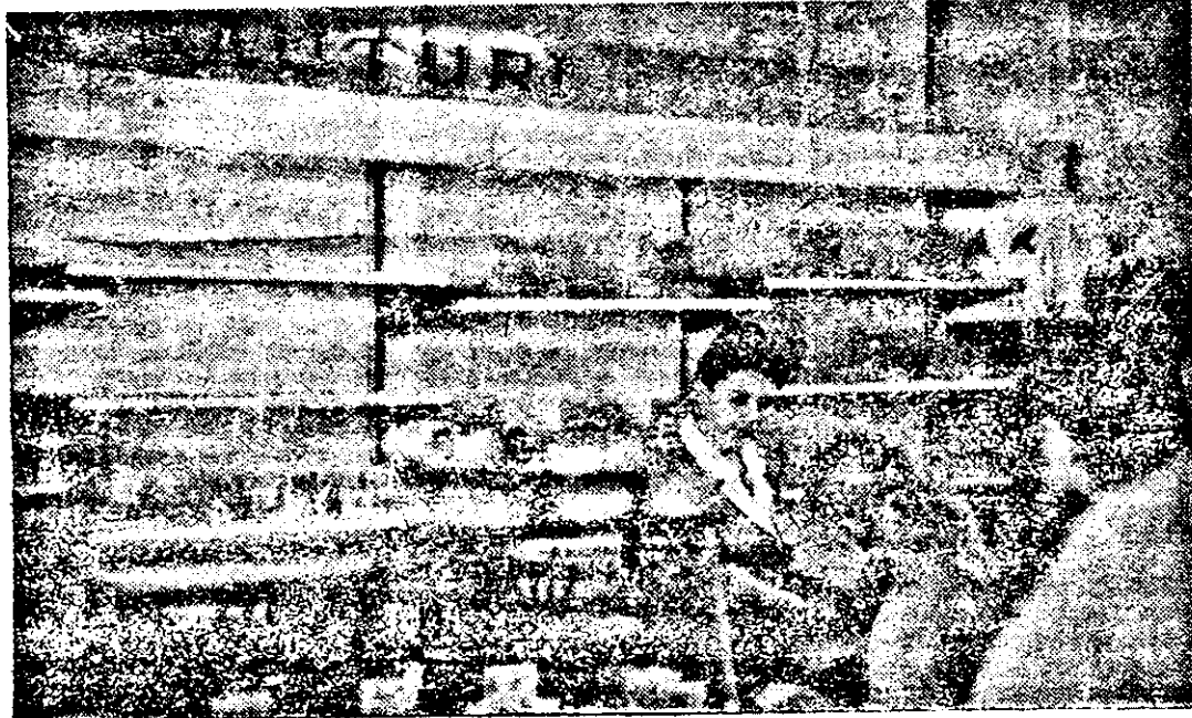
În ultima vreme, cam așa arată raioanele de băuturi din unitățile ICS Alimentara.