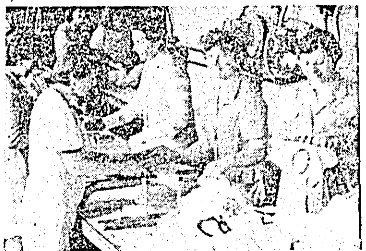
Aspect de muncă în atelierul imprimăriei al întreprinderii „Tricolorul roșu”.