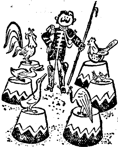
(Az oroszlánszelidítő visszavonult birtokára, de nem tud szakítani multjával...)